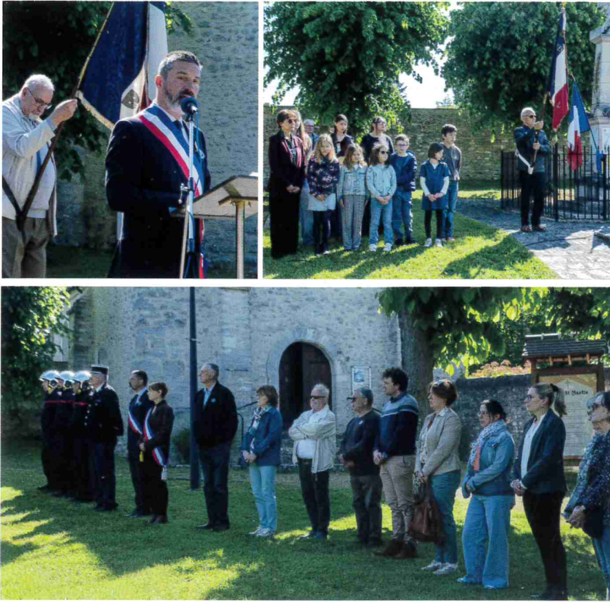
Discours officiel et dépôt de gerbes au monument aux morts.

Ce 8 mai 2026, place de l'église, s'est déroulée la commémoration de la capitulation allemande et la fin de la seconde guerre mondiale, le 8 mai 1945.