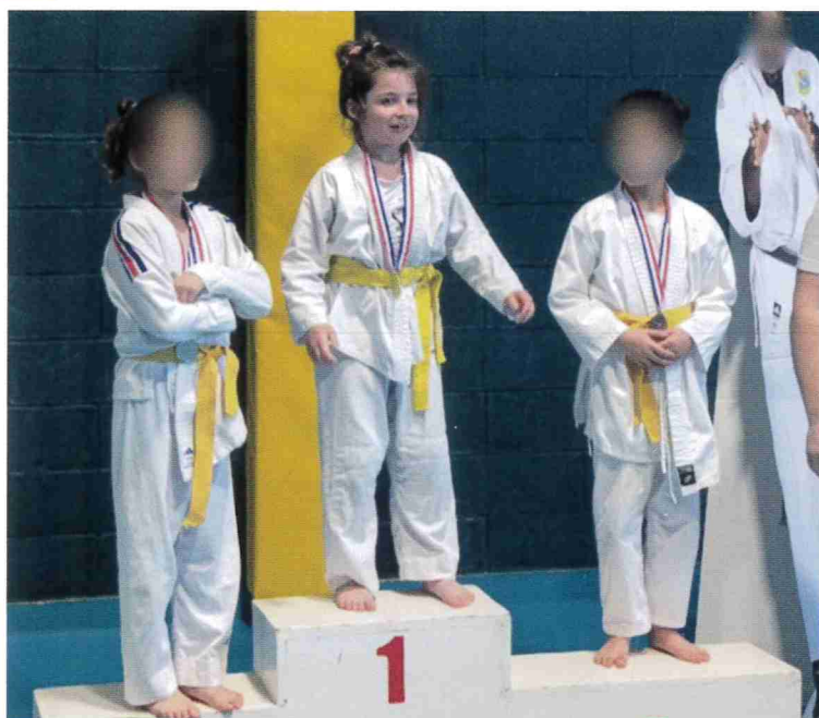
LYANA (1 RE TOURNOI DE GRAVIGNY)