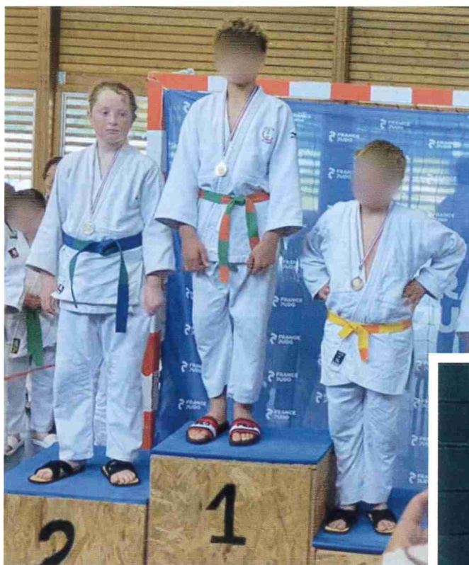
NOÉ (2 E COUPE DE L'EURE)